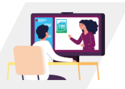
02 Manual de buenas prácticas con formación On-line