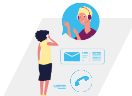
01 Asesoría y evaluación

Tiene la doble garantía de estar diseñado por profesionales de la certificación, y validado por profesionales de la salud.